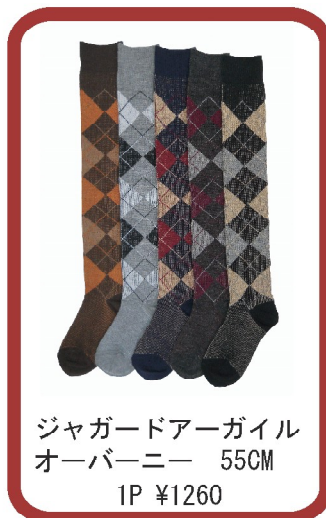
ジャガードアーガイル オーバーニー 55CM 1P ¥1260