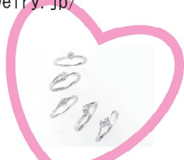
¥255,000~¥485,000 (本体価格) 高硬度プラチナ (Pt950)