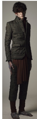
JACKET ¥92,400 PANTS ¥56,700 LEGGING ¥12,600