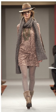
ONE-PIECE ¥46,200 STOLE ¥17,850