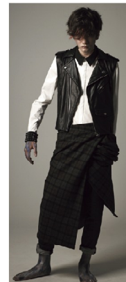
VEST ¥47,250 SHIRT ¥48,300 WRAP SKIRT ¥42,000