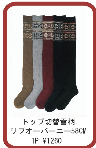
トップ切替雪柄 リップオーバーニー58CM 1P ¥1260

@KAMISHIMA CHINAMI SHOWROOM 東京都渋谷区渋谷2-8-17 TEL:03-3406-9210