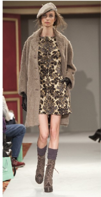
COAT ¥94,500 ONE-PIECE ¥30,450

スペイン発のレディースブランド 今シーズンはクラシックなテイストを 取り入れたデザインが特徴的。